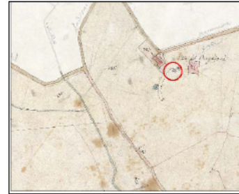
Estratto Catasto 1824: