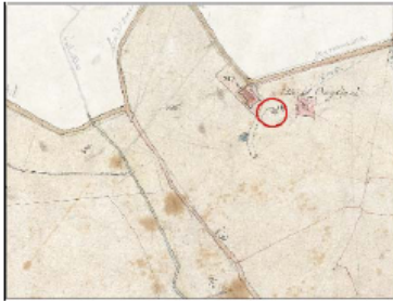
Estratto Catasto 1824: