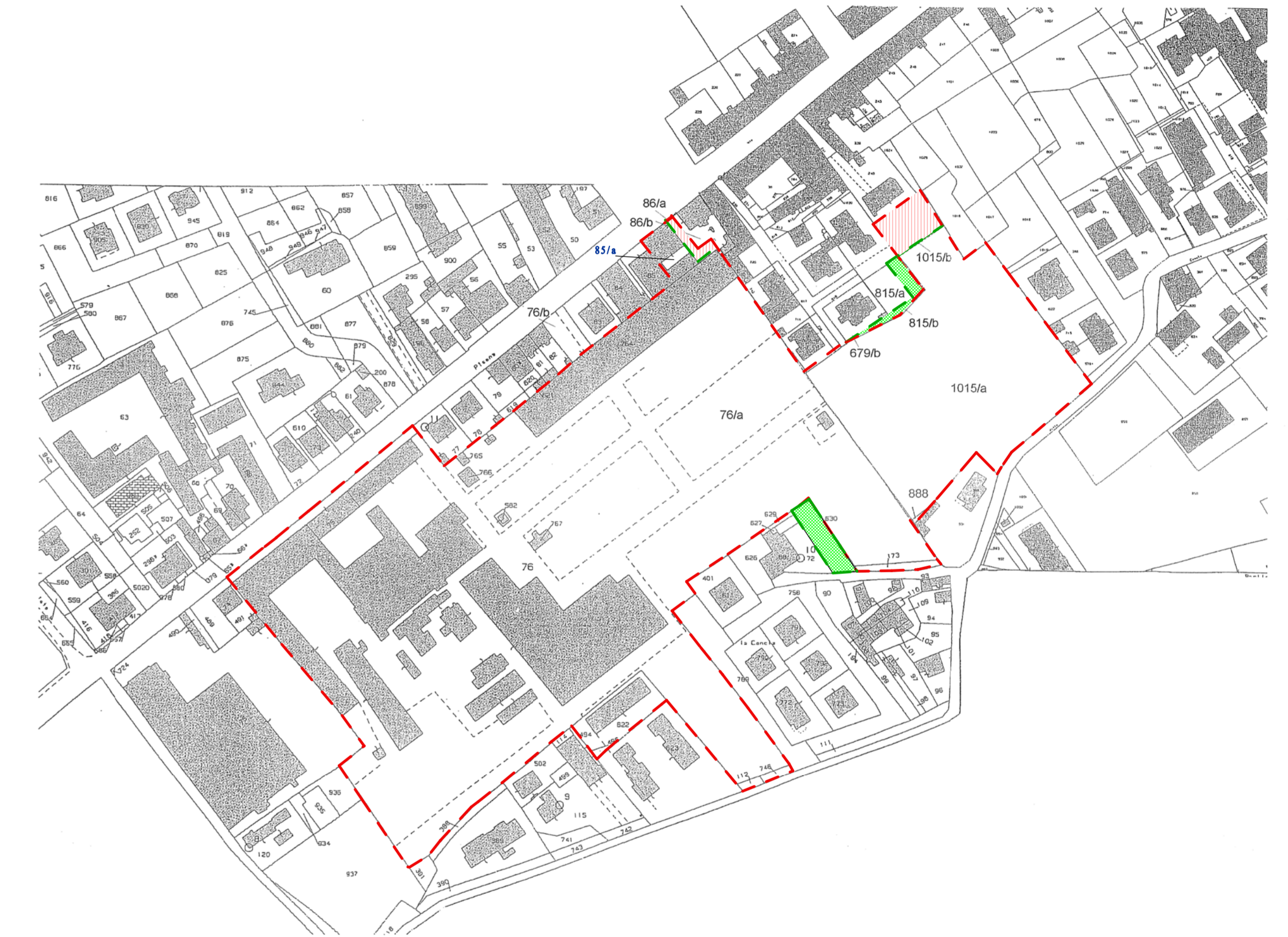
Estratto Catastale Scala 1: 2000