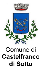
Comune di Castelfranco di Sotto